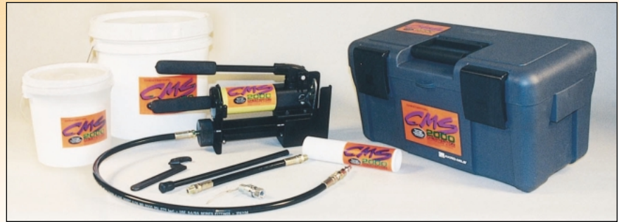
El Sellador de Bombas CMS-2000 CHESTERTON se suministra en barras y a granel para la carga inicial de la caja y en cartuchos para el sellado final bajo presión para eliminar los huecos. Luego, se usan los cartuchos para todos los subsecuentes sellados. Arriba se muestra el nuevo Sistema Manual. Este nuevo sistema ofrece un diseño de pistola mejorado y viene con su propio estuche equipado con mangueras de inyección, fluido hidráulico, conexiones para paso de flujo, una llave de manguera y una calculadora de volumen del CMS 2000.

Los Selladores CMS-2000 CHESTERTON para Bombas, crean un anillo sin fin de compuesto, moldeado a las irregularidades de la caja y eje o camisa. No hay trayectos para las fugas y se pueden eliminar las purgas. Los Selladores CMS-2000, al mismo tiempo de obturar las fugas, también ahorran dinero gastado en la instalación de purgas y su recuperación, reemplazos de camisas e inventarios de empaquetaduras convencionales para varios tamaños de bombas.