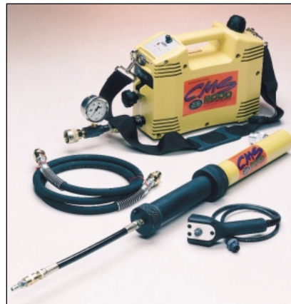
El Sistema de Inyección Automatizado ofrece mayores velocidades de carga, total portabilidad y energía para todo el día en los sitios de trabajo. Este sistema provee 8 horas de operación hidráulica con pilas, retracción automática del cilindro, manejo con una mano y control remoto.